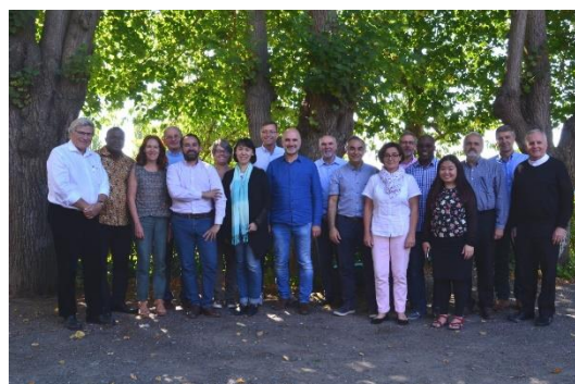
Première réunion du Conseil de Fondacio avec les proches collaborateurs, fin septembre à Angers, suite au Congrès de mai en Asie

Le Conseil de Fondacio s'est réuni pour une première séance de travail à Angers. A partir des orientations 2018-2023 définies au Congrès, en mai dernier, une nouvelle étape de Fondacio commence avec une vision claire et partagée. Se développer et innover passent par la dynamique des groupes communautaires, de nombreux projets, la formation et les instituts animés avec des partenaires. Au coeur, il y a l'ADN de Fondacio puisé à la source de l'Évangile et vecteur de transformations des personnes, des relations et de l'engagement au service d'un monde plus humain et plus juste.