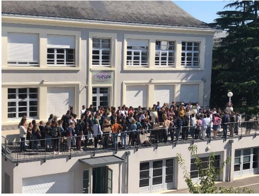
La cour de l'IFF Europe à Angers, à la rentrée. 130 étudiants en 2018/19

Magnifique vue de mon bureau le 4 septembre dernier ! La cour de l'IFFEurope, Institut de Fondacio à l'Esvière (Angers) accueillait un premier groupe d'étudiants pour l'année académique 2018/19.