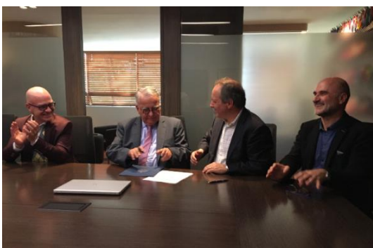
Signature d'un nouvel accord en présence du Doyen de la Faculté de théologie et du Vice-Recteur de la Universidad Javierana de Bogota (Colombie)

Video : Opening of the International Fondacio Meeting - 2018