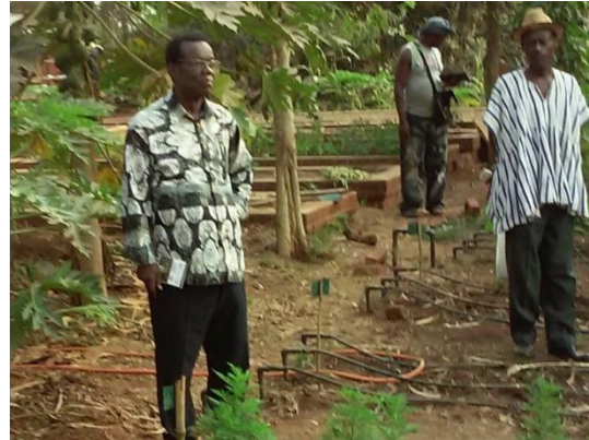
Fondacio Togo - Sichem : Maison de l'Artémisia pour éradiquer le paludisme